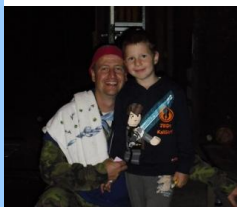
radoval se Haše. Jenda se